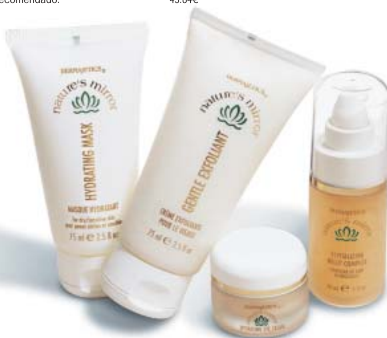
Imagen representativa – los productos varían según el país

Day Defense es una crema hidratante que combina un sistema de liberación continua con vitaminas que combaten los radicales libres para fomentar una piel limpia, suave y sana. #0303 PVP recomendado: 36.50€